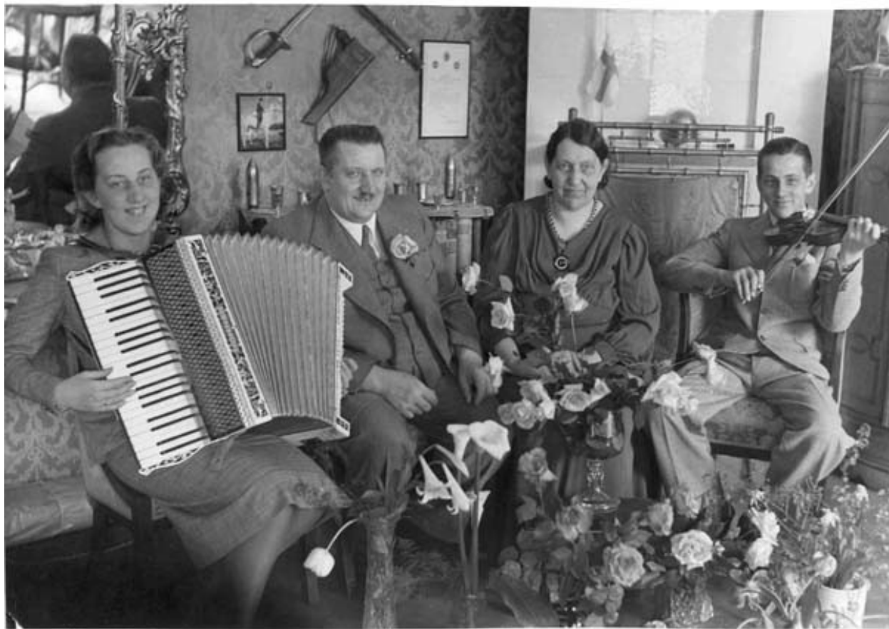
Kaas syntymäpäiväserenadi. 12.6.39.